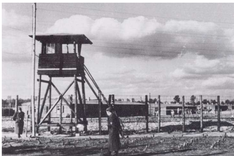
Vue du Stalag Luft III, Copyright: IWM HU21018.

Nils Jørgen et quatre de ses camarades réussirent à arriver à la frontière danoise, mais ils furent capturés le 29 mars, deux jours après l'évasion de Stalag III. Quand l'une d'entre eux se fit tirer dans le dos, les trois autres se détachèrent des gardiens, mais ils furent également abattus.