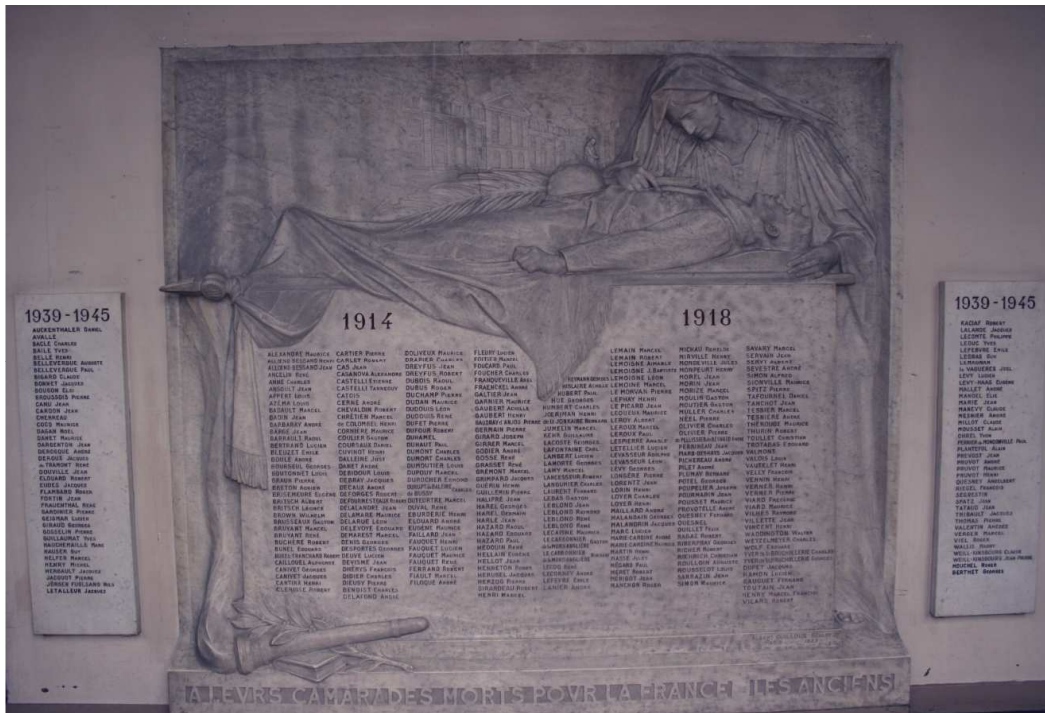
Monument aux Morts dans l'enceinte du lycée Corneille de Rouen